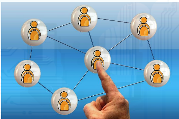
Phân quyền truy cập tài liệu lưu trữ người dùng