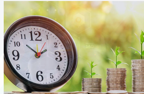
Tiết kiệm chi phí, nâng cao hiệu suất công việc